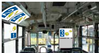
1 窓吊 2 額面 3 運転席後部