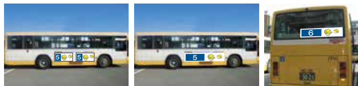
5 外側ステッカー(小)