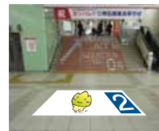
2 フロア (①共用コンコース) 3 ステップ