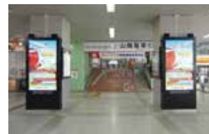
6 SANYO AKASHI ツインビジョン