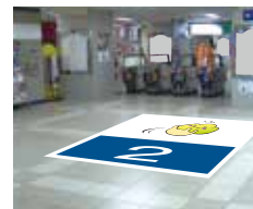
2 フロア (③改札内)